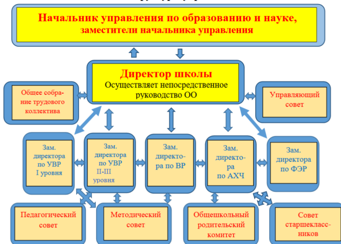
Схема структуры управления