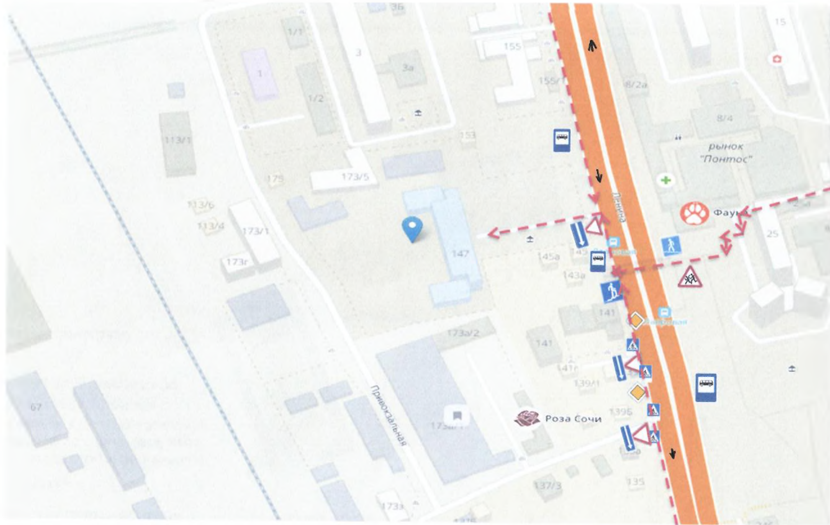
схема расположения ОУ, пути движения транспортных средств и детей (учеников, обучающихся)